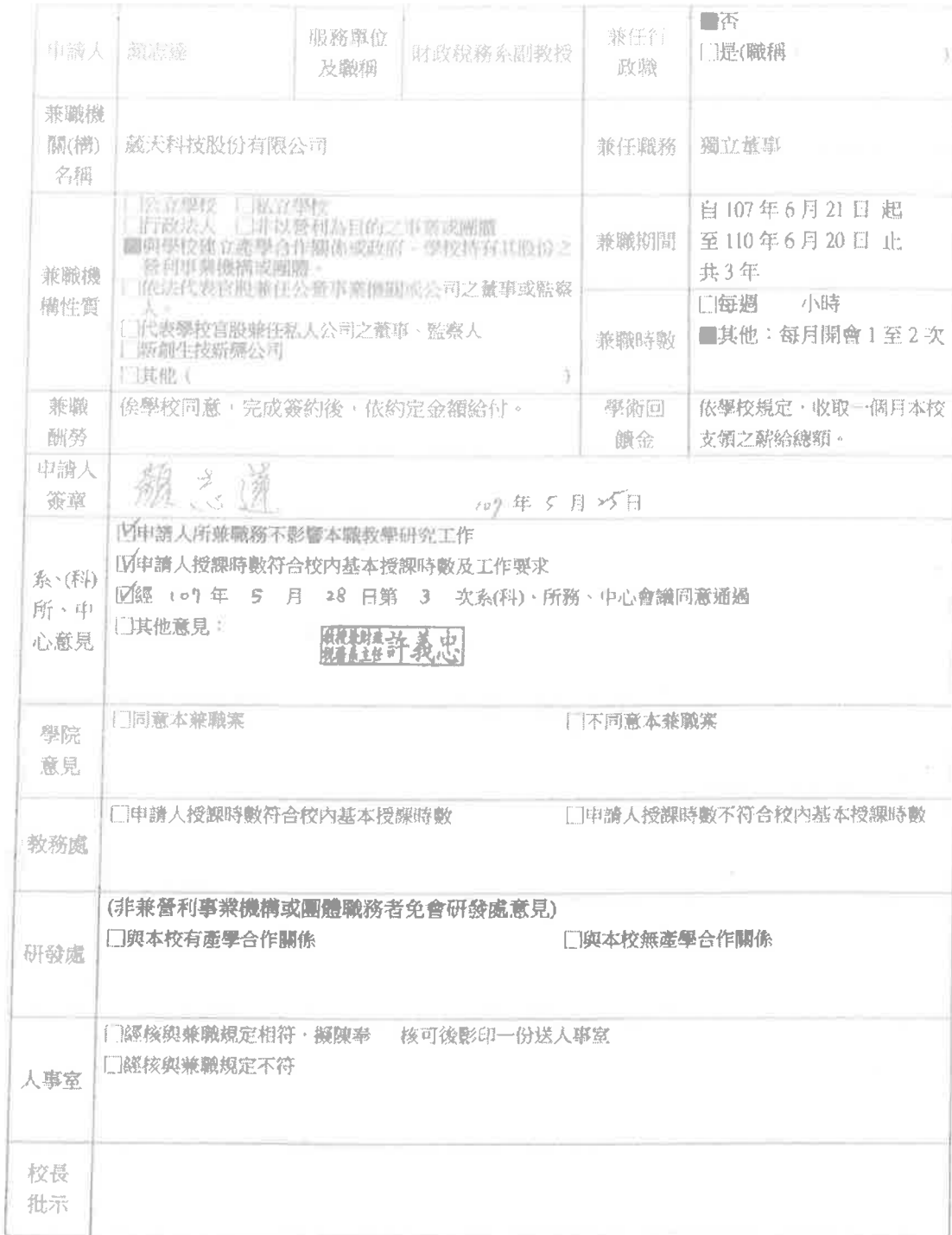
國立臺中科技大學專任教師兼任非政府機關申請表