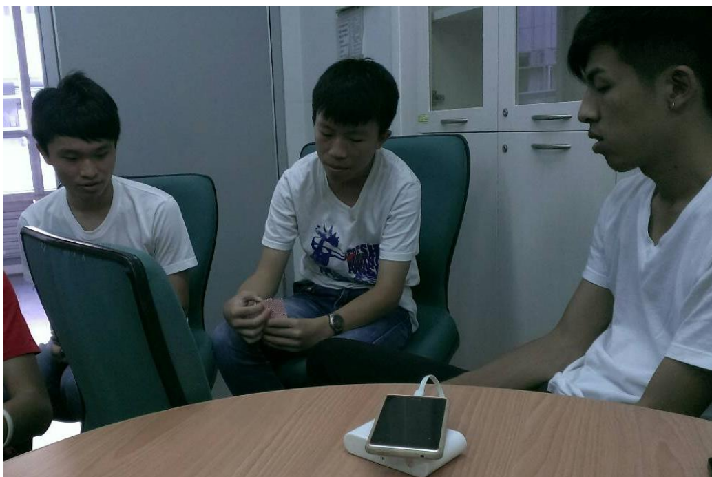
想像的時候，遇到了困難 他們正在思考