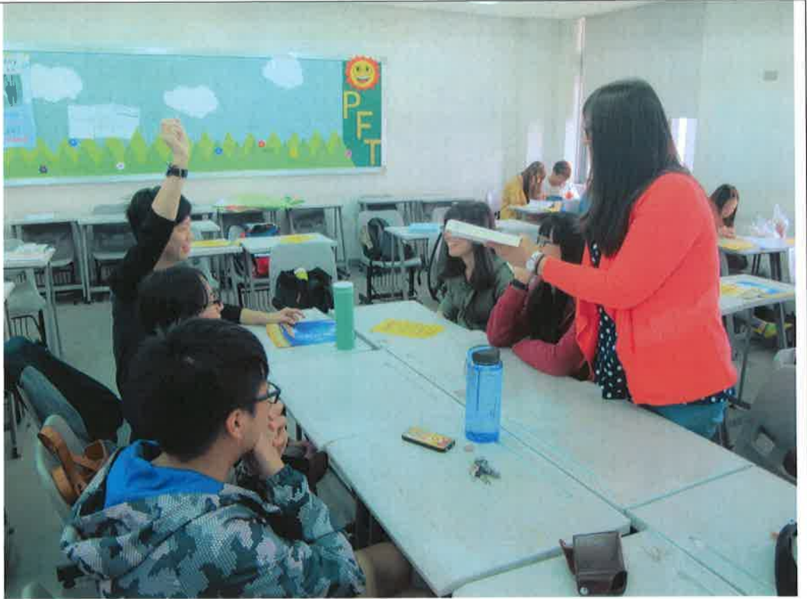
照片說明：同學彼此提出疑問，討論中！