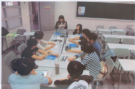
照片說明：同學正朗讀一段內容給大家聽

解決方法：上網或是找相同類型的經濟書找尋答案，如果最後還是無法找到解答，就請教系上的經濟老師。