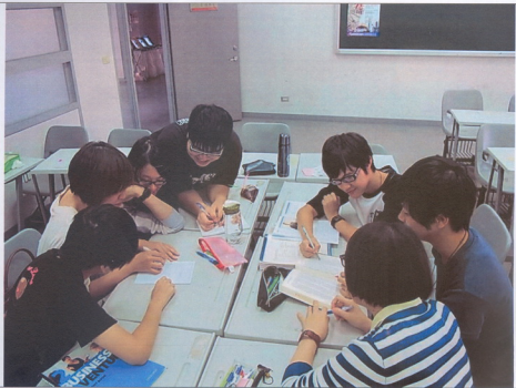
照片說明：同學分為2組討論，一方記錄問題另一方查考書籍。

討論照片 (照片請每月至少繳交兩張照片(電子檔), 照片至少需為1024*768px, 300KB以上。)