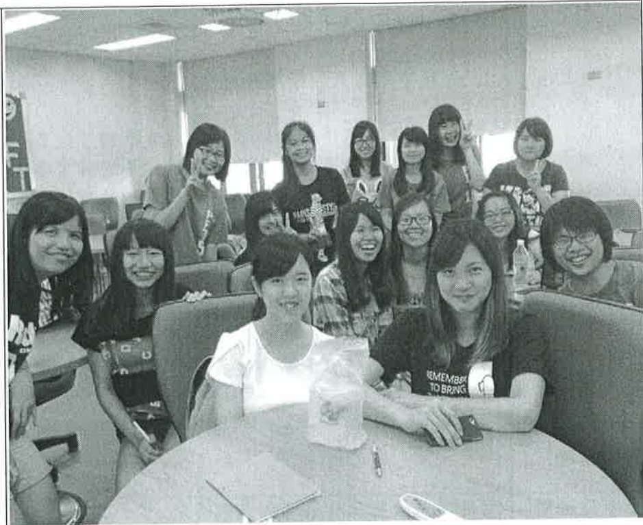
讀書會中大家一起合照