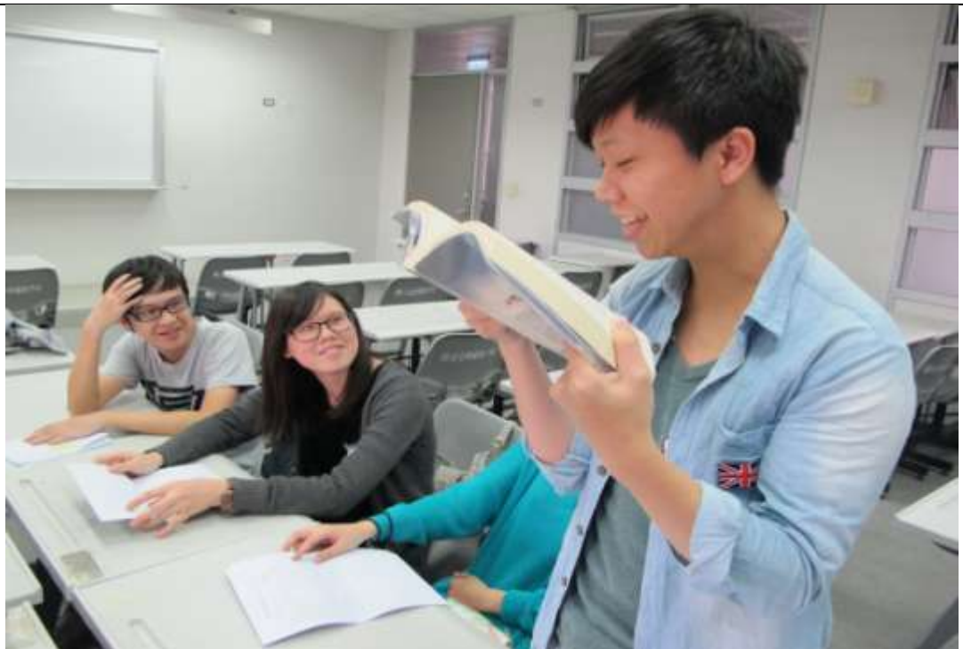
另外一位同學朗讀下一章節