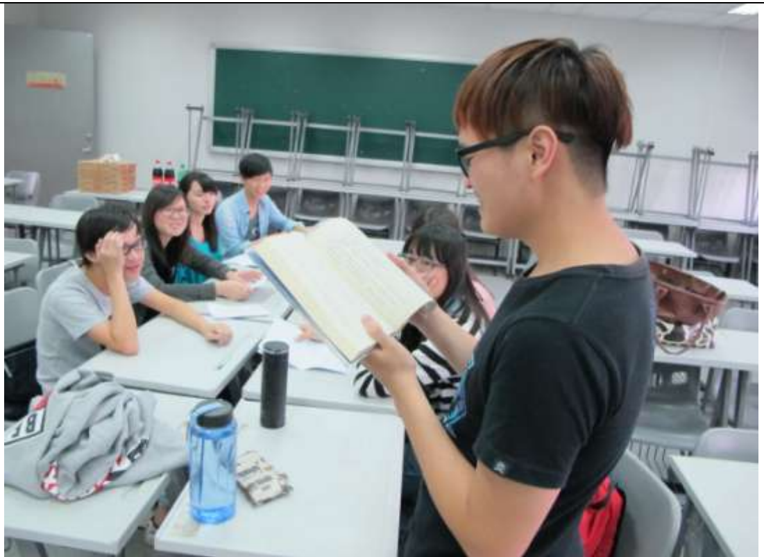
請一位同學朗讀其中一段