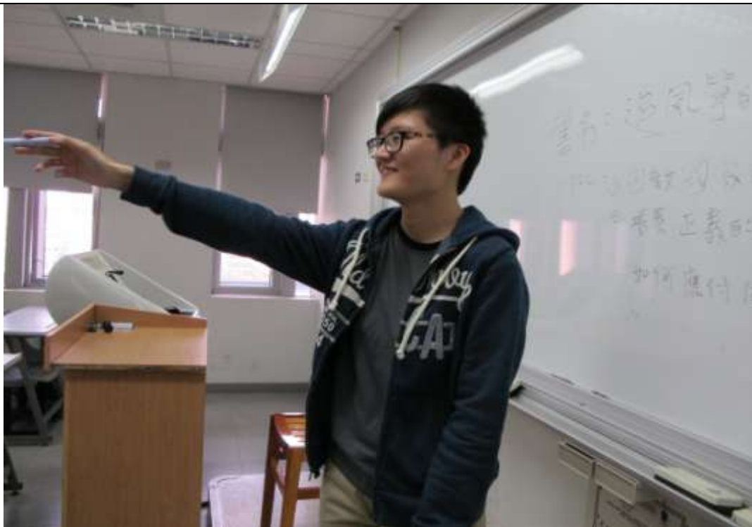
主持人主持讀書會