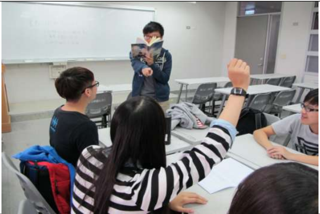
同學舉手回答問題