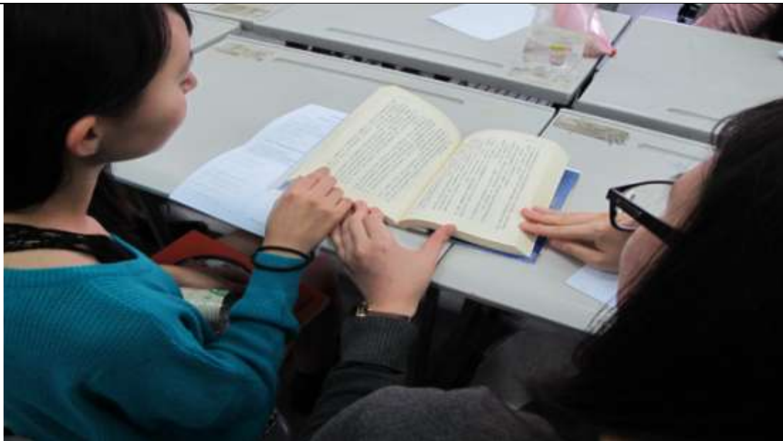
同學分組閱讀討論