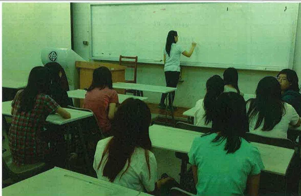
主持人寫出書名及問題

讀書會討論 照片 (照片請每 月至少繳交 兩張照片 (電子 檔),照片至 少需為 1024*768px ,300KB以 上。)